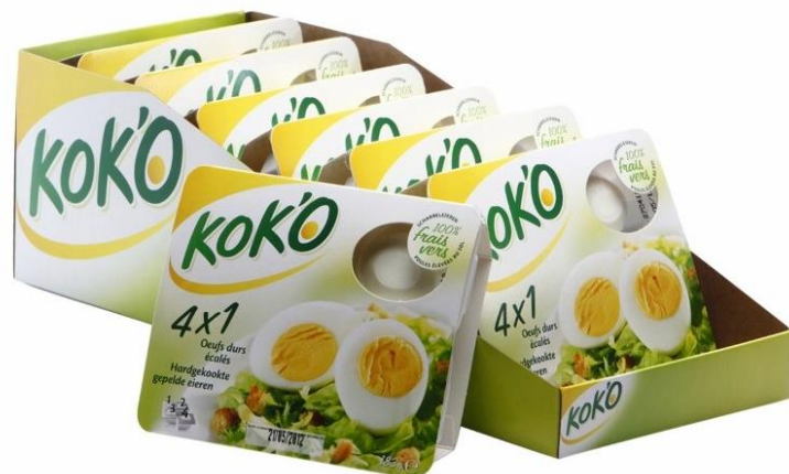
Lecoque lanceerde onlangs KOK'O: hardgekookte eitjes, klaar voor onmiddellijk gebruik