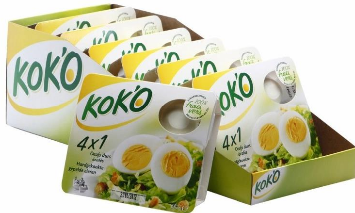
Lecoque lanceerde onlangs KOK'O: hardgekookte eitjes, klaar voor onmiddellijk gebruik